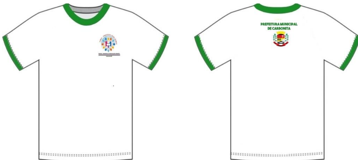
Foto meramente ilustrativa de como deverá ser o modelo comprado

No lado esquerdo do peito deverá ser silkado o Brasão da Escola da Rede Municipal de Ensino de Carbonita/MG